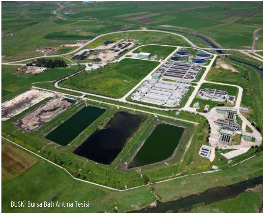
BUSKİ Bursa Batı Arıtma Tesisi

Projenin geri kalan maliyetlerinin BUSKİ'nin öz kaynaklarından finanse edileceğini belirten BUSKİ Genel Müdürü İsmail Hakkı Çetinavcı, Alman Kalkınma Bankası'ndan temin edilen finansman ile yağışlı hava debileri 31.000 ve 6.000 metreküp/gün arasında 6 adet atık su arıtma tesisi ile yıllık kapasitesi 240.000 ton/gün