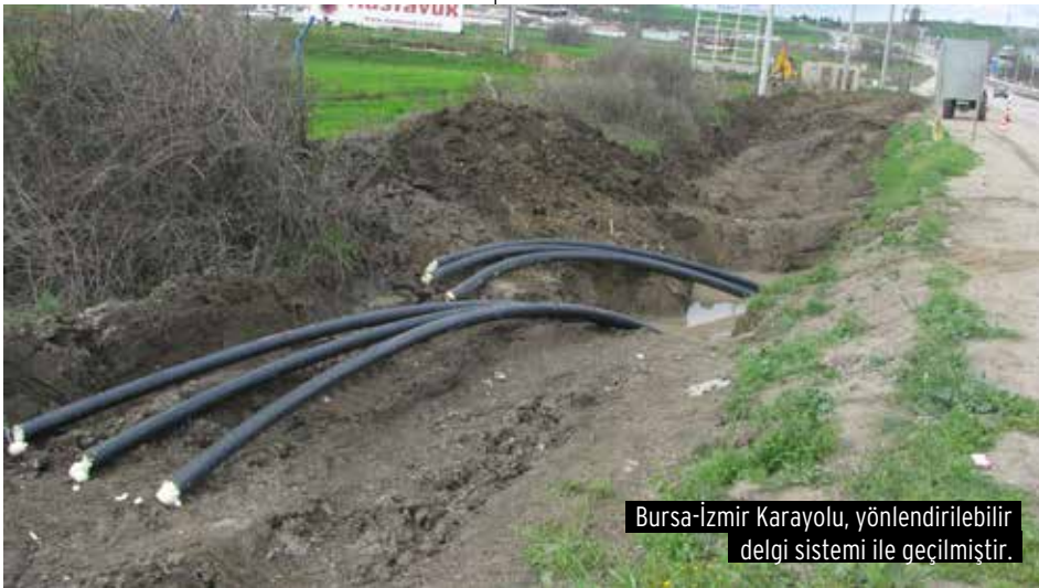
Bursa-İzmir Karayolu, yönlendirilebilir delgi sistemi ile geçilmiştir.

Projemizi tamamladığımızda HOSAB, sanayicilerine kesintisiz ve daha ucuz elektrik enerjisi temin edecektir.