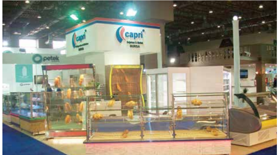
Capri; Market, Sütçük, Pasta, Ekmek, Baklava, Isıtmalı ve Nötr, Balık Teşhir Reyonları, Depo Tipi ve Tezgah Tipi Buzdolapları, Soğuk Hava Depoları ve Salatbarlar dizayn edip üretiyor.

Market, kasap, pastane, unlu mamuller, fırın, otel ve restoranlara dönük ürünler üreten Capri Endüstriyel Soğutma ve Mutfak Ekipmanları, kadrosunda bulunan mimar, mühendis ve teknik ekibiyle proje, imalat, montaj ve işletmenin açılışına kadar olan tüm aşamalarda hizmet veriyor. Firmanın ihracat ağında ise Avrupa ülkeleri, Türk Cumhuriyetler, Avustralya, Kuzey Afrika ve Ortadoğu ülkeleri bulunuyor. Capri, üretiminin yüzde 50'ye yakını ihraç ediyor.